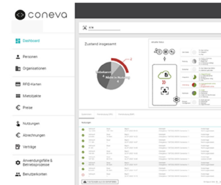
coneva CPO-Services („All-Service“)

Konzept der Ladesteuerung durch Dynamisches Lastmanagement