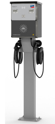
EV Charger, Ladesäule