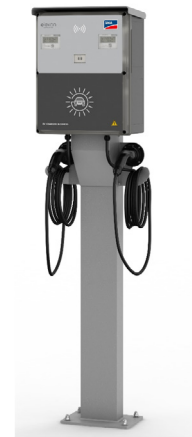
EV Charger, Ladesäule