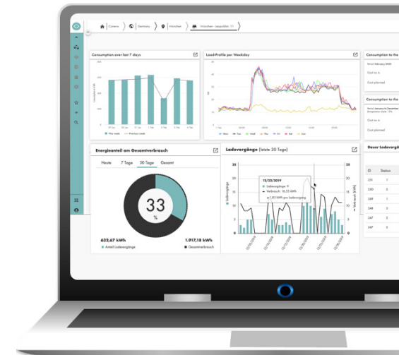
coneve Monitoring mit integrierter Visualisierung